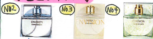
フレッシュアップルの香り ヒュアフローラルの香り スズランの香り